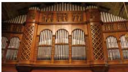
Steinmeyer Orgel, Christuskirche